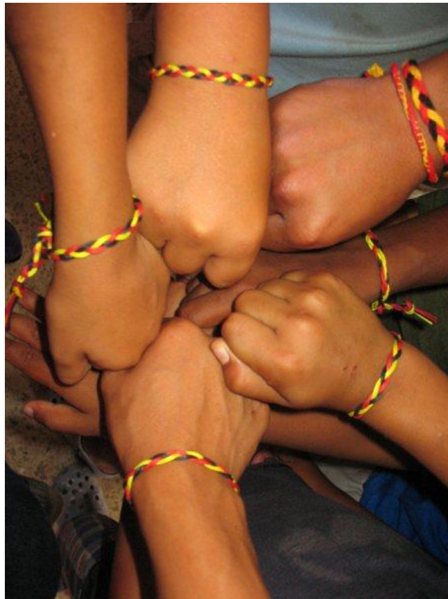
...und das sind unsere geflochtenen Freundschaftsbänder aus Vaterstetten!