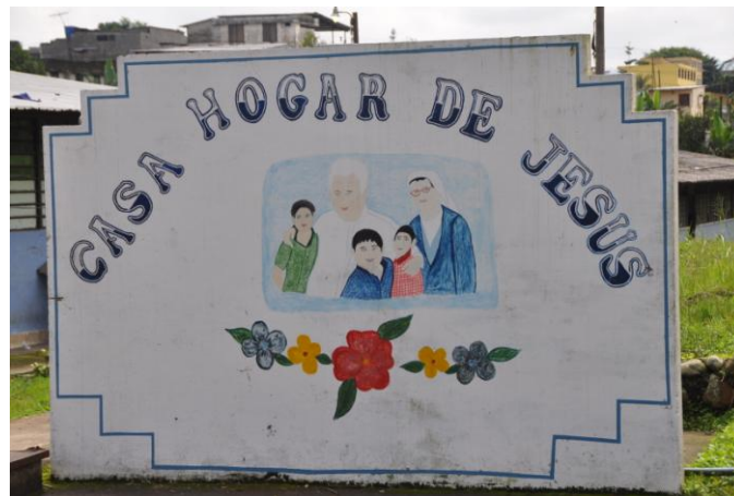
Am Eingang zum Waisenhaus für „Straßenkinder“