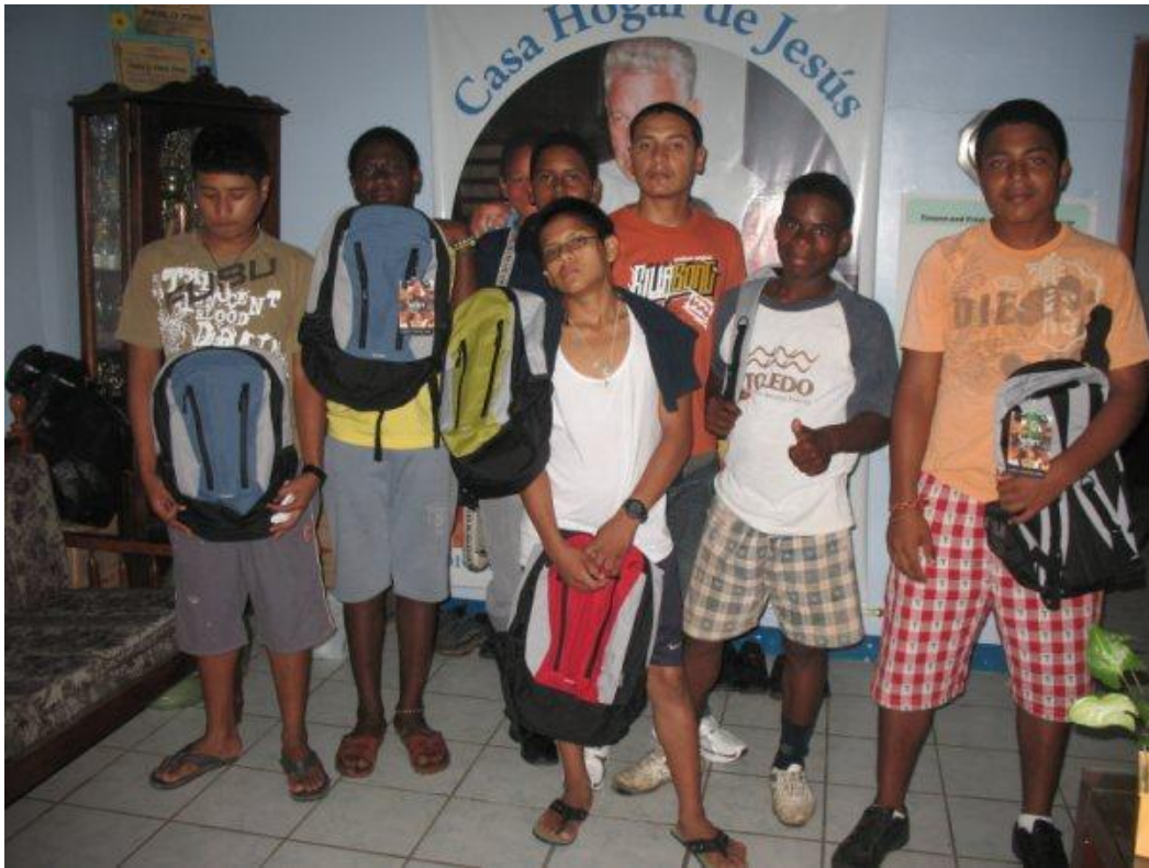
Die Jungen bekommen neue Schulranzen ...und